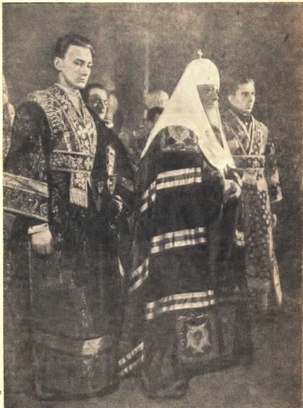
Святейший Патриарх Алексий перед вручением ему патриаршего посоха